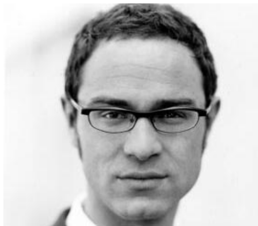
Daniele Ganser, Friedensforscher und Spezialist für verdeckte Kriegsführung.

Das Wichtigste gleich vorweg: Was wirklich zu den Terror-Attentaten am 11. September 2001 führte, das konnte auch der Sicherheitsspezialist Ganser nicht abschliessend beurteilen. Aber immerhin lieferte er den rund 150 9/11-Interessierten im vollbesetzten Clubsaal der Roten Fabrik in Zürich plausible Hintergründe und drei logisch strukturierte Erklärungs-Theorien mit einer systematischen Analyse der zwölf wichtigsten Streitpunkte.