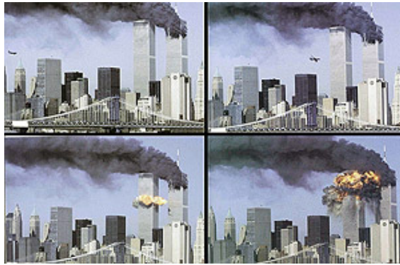
Einschlag des zweiten Flugzeugs in den Süd-Turm des World Trade Centers am 11. Septembers 2001 um 9:03 Lokalzeit in New York (Ablauf von links oben nach rechts unten).