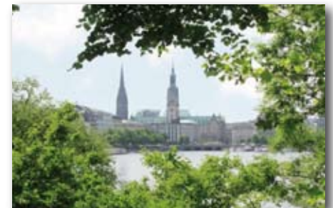
Hamburg – „die Schweiz des Nordens“

der Initiative „Für faire und verbindliche Volksentscheide“ jubelte: „ Eine solche Regelung gibt es bisher nur in der Schweiz. “ (Quelle: Hamburger Morgenpost , 7.11.2008)