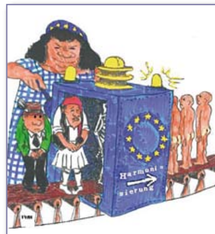
Die EU selbst ist die Harmonisierungs- und Globalisierungs-Antriebsmaschine

sentlich stärkere Regulierung der Finanzmärkte als bisher und die Schutzfunktion des Staates für seine Bürger einzufordern. Entlarven wir das Argument, die EU schütze uns vor den Auswirkungen der Globalisierung, als das was es ist: eine weitere Propaganda-Lüge der „Macht- und Finanz-Eliten“ mit dem Zweck, die wirklichen Zusammenhänge zu verschleiern und die Bürger und Völker Europas weiterhin ohne nennenswerte Widerstände ausbeuten zu können. (nos)