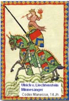
Minnesänger Ulrich v. Liechtenstein erwähnte 1227 erstmal urkundlich Mürzzu- schlag.

Dass durch die Zulassung von gentechnisch verändertem Getreide sowie generell von Lebensmitteln die Gesundheit der gesamten Bevölkerung langfristig großen Schaden er-