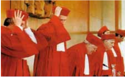
Karlsruher Verfassungsrichter in ihren roten Roben.