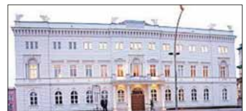
Palais der Bertelsmann-Stiftung, Berlin

vor allem um direkten Einfluß auf politische Entscheidungen , wobei sich die Frage stellt, ob sie die Politiker nur beraten oder selbst Politik machen. Demokratische Kontrolle? Fehlanzeige! Kritiker sprechen von „ Macht ohne Mandat “. Leitbild ist der Neoliberalismus. Die Prinzipien der sogenannten „freien Marktwirtschaft“, in der allein Gewinn, Leistung, Effizienz und äußerer Erfolg zählen, sollen in allen Lebensbereichen Anwendung finden, nicht zuletzt in der