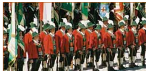
Schützenkompanie – Niederdorf /Südtirol

Trachtenvereine, Schützen, Musikkapellen, Kameradschaftsverbände u.v.a. werden sich hervorragend präsentieren. Die Pflege von überlieferter Tradition, heimischer Kultur und das Hochhalten christlicher Werte sollen vorgelebt werden. Wie sonst kann unsere Nachfolgeneration sie erleben und weitergeben?