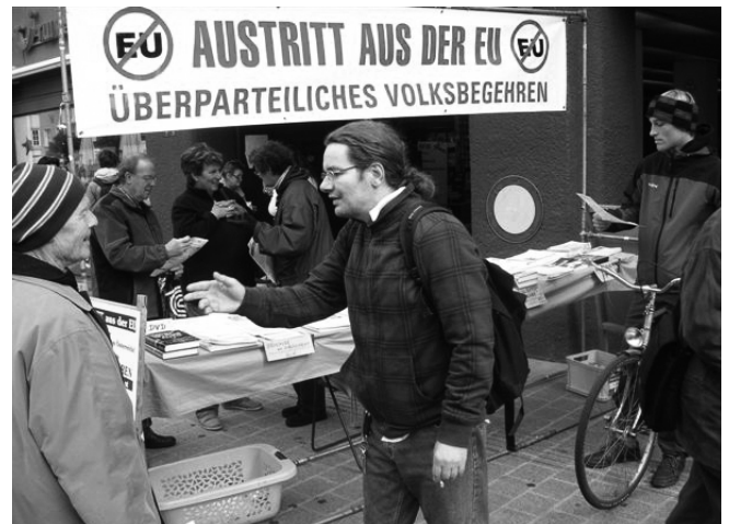
Aufklärungsarbeit in vielen Gegenden Österreichs, hier im Stadtzentrum von Innsbruck.

Die Energieversorgung Europas wird durch die Pipeline NABUCCO keineswegs sicherer. Warum soll angesichts des türkischen